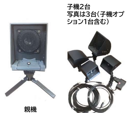
子機2台 写真は3台(子機オプション1台含む)